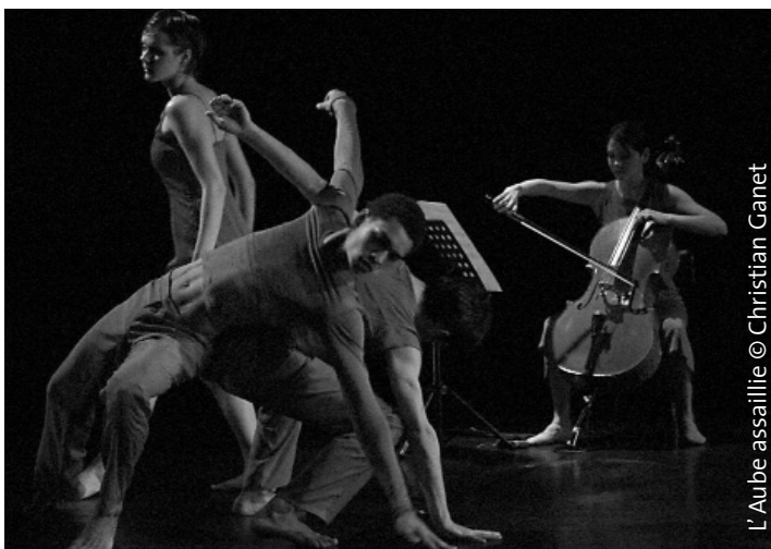
L'Aube assaillie

L'Aube du millénaire a vu s'effondrer l'illusion d'un monde mu par la seule croissance économique.