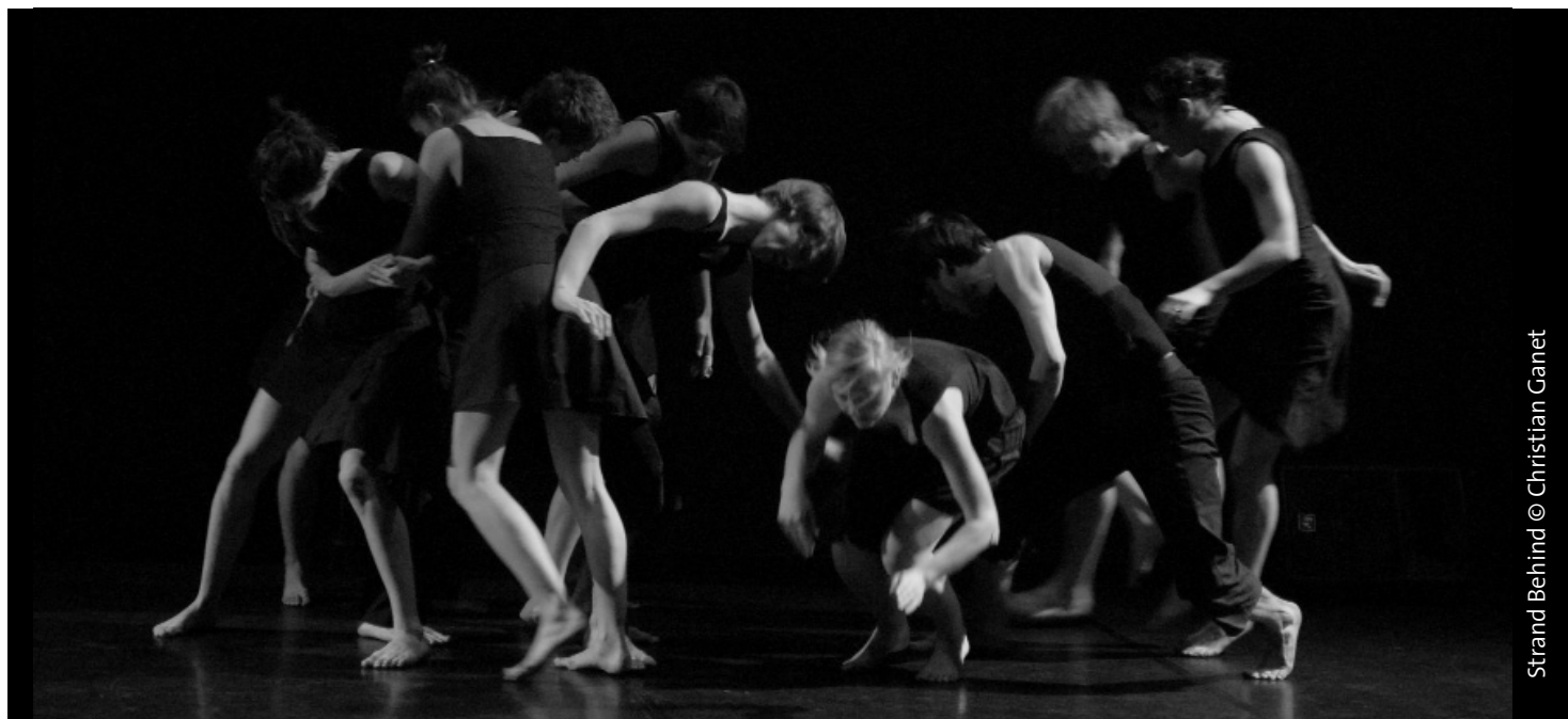
Strand Behind