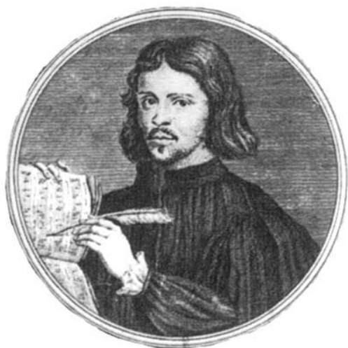
Thomas Tallis, gravure de Niccolò Haym